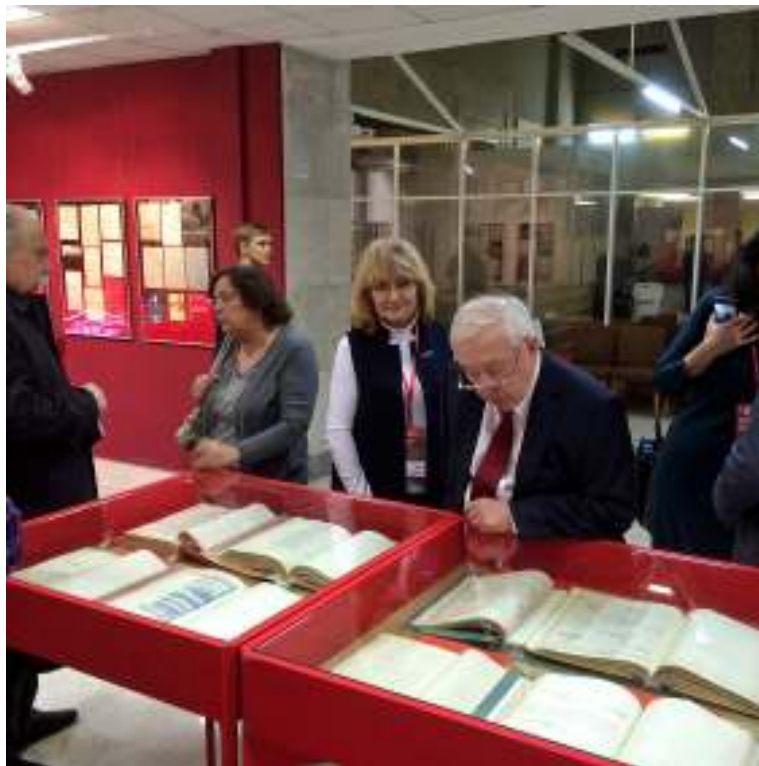
На выставке «Большой террор. 1937—1936»