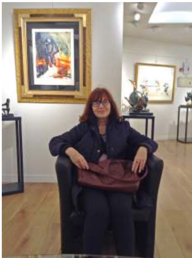
В Доме-музее Сальвадора Дали. Париж, Монмартр, 2012