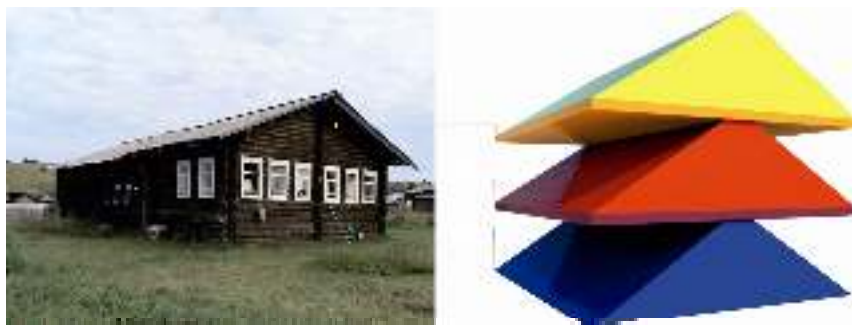
Рис. 1. Семантико-смысловое значение вертикальной структуры дома коми-зырян (▲ — верхний мир, ▲ — средний мир, ▲ — нижний мир). Разработка автора, 2015 г.

Высокая степень семиотичности особенно показательна для зонирования горизонтального плана жилого пространства (рис. 2). Основными композиционно-смысловыми узлами традиционного интерьера были углы. Каждый угол имел свое название и был наделен определенной функцией. К таким функционально-смысловым углам относились красный, печной, женский, мужской углы. Все они были сакрализованы и несли особый знаковый статус. В ходе исследования было выявлено, что весь ансамбль предметного наполнения традиционного жилого интерьера формировался возле двух базовых композиционных узлов — красного угла и печи. Диагональное расположение красного угла и печи было строго регламентировано и являлось каноном. Материалы научных исследований показывают, что на формирование традиционной моделировки жилого пространства дома коми-зырян оказали влияние три основных фактора: хозяйственно-экономический, социально-половой и ритуально-мифологический.