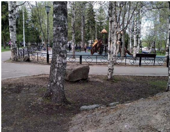
Валуны на территории «Детского парка» в парке им. Кирова, г. Сыктывкар

Известно, что первое поселение, давшее начало городу, располагалось именно здесь [7, с. 12]. В этом погосте стояла деревянная, срубленная в виде четырехстенной избы-клетки, теплая церковь св. Георгия Победоносца, упоминаемая в писцовой книге 1586 года, а с 1646 года и холодная Троицкая деревянная церковь, простоявшие вплоть до времени постройки каменной Покровской церкви, освященной в 1740 г. А почти через 70 лет сложился и весь комплекс Троицкого собора [7, с. 141–144].