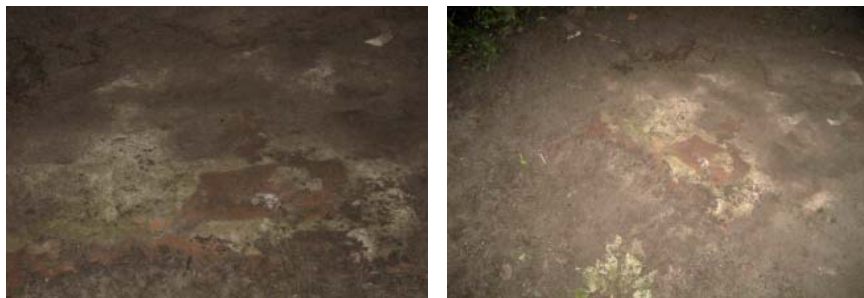
Предположительно, сохранившийся фрагмент стены Троицкого собора на территории «Детского парка» в парке им. Кирова

В нескольких метрах от скейт-площадки, в сторону «замка Берендея», в земле, под корнями деревьев, обнаружился большой фрагмент кирпичной стены со следами штукатурки.