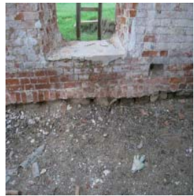
Фундамент въездных ворот с надвратной церковью

Подтверждением данного рассуждения может служить и гипотеза о найденных валунах, предположительно, от деревянной Нижнеконской церкви села Тентюково. Крестовоздвиженская церковь села, построенная в конце XIX века, была закрыта в начале 1930-х годов. По свидетельствам-воспоминаниям старожилов, церковь после закрытия сельчане разобрали и перенесли в центр Тентюково 1 .