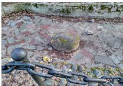
Фото валунов, вмонтированных в оформление «замка Берендея» на территории «Детского парка» в парке им. Кирова, г. Сыктывкар