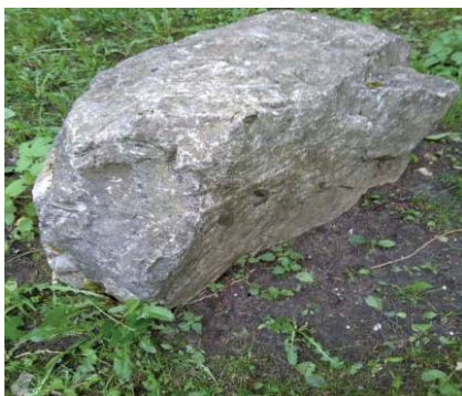
Валуны на территории «Детского парка» в парке им. Кирова, г. Сыктывкар

Поскольку валуны большие и довольно тяжелые, то можно заключить, что их привезли не издалека для строительства «замка» и нашли им применение на месте организованного парка для детей. Следуя этой логике, валуны и камни, вмонтированные в обрамление берендеевского пруда, тоже из церковного фундамента.