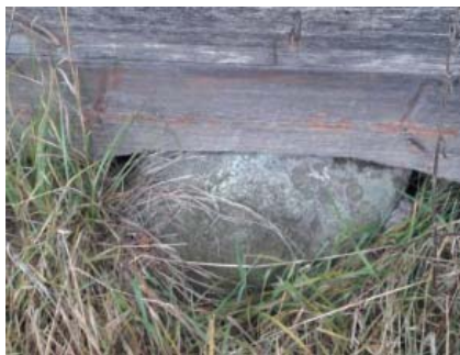
Фундамент (валуны) часовни св. Николая Чудотворца в д. Березник с. Ыб РК

Другим примером может служить часовня св. Прокопия и Иоанна Устюжских в д. Нижний Койтыбож, 1776 года постройки. Часовня стоит на валунах и камнях, обилие которых создает буквально высланную площадку.