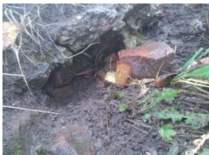
Предположительно, сохранившийся фундамент Троицкого собора на территории парка им. Кирова