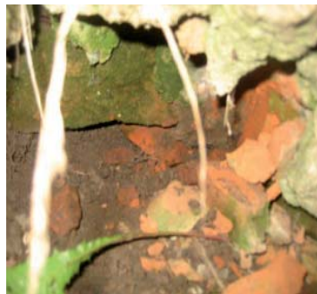
Предположительно, сохранившаяся кладка фундамента Троицкого собора на территории парка им. Кирова