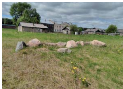
Сохранившиеся валуны от храма св. Стефана Пермского в Кылтовском Крестовоздвиженском женском монастыре, с. Кылтово Усть-Вымского района РК

По свидетельствам матушек монастыря, валуны отеснили в сторону во время распашки колхозной земли. Поэтому установить точное местоположение церкви теперь затруднительно. Однако сам факт и их судьба породили гипотезу о том, что в Сыктывкаре, на территории современного Кировского парка, около «замка Берендея», находящиеся валуны, схожие один в один по размеру и плоским краям с кылтовскими — артефакты духовной культуры, а именно, являлись частью фундамента храмов Троицкого прихода.