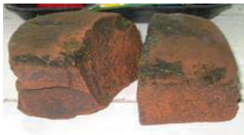
Предположительно, кирпич из кладки Троицкого собора на территории парка им. Кирова

Несколько извлеченных кирпичей оказались разными по размеру, целыми, с неровными краями отверстий в одном из них. Кирпич крепкий, плотный, тяжелый.