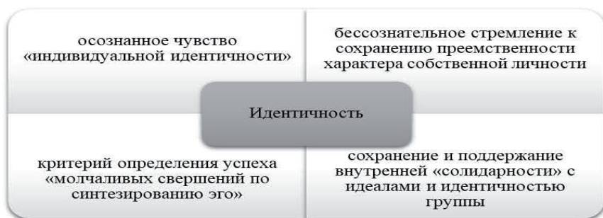
Рис. 1. Элементы идентичности

В результате Э. Эриксон выделил четыре элемента личностной «идентичности» (рис. 1).