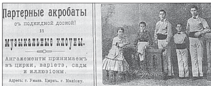
Рис. 1. Рекламный блок журнала «Сцена и арена», 1914 г.

Второй номер журнала содержит на своих страницах отчет о заседаниях совета, число членов общества и суммы пожертвований. Интересны статьи, вошедшие в этот номер. В одной из них затрагивается вопрос о расслоении среди артистов. В анонимной статье «Неудобно» представлены артистические «касты»: