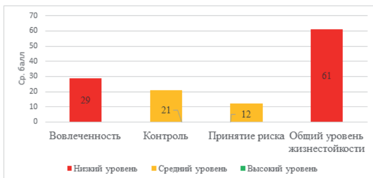
Рис. 1. Степень выраженности жизнестойкости и ее компонентов в ЭГ на констатирующем этапе (ср. балл)

кий уровень жизнестойкости позволяет пожилым людям легче переносить тревогу при выборе неизвестного, справляться со стрессами и оставаться активными в решении жизненных задач [6, с. 121–122]. Помимо этого, отдельные компоненты жизнестойкости ЭГ находятся в преобладании средних и низких уровней, что характерно для людей, ощущающих себя отвергнутыми, вне жизни, и это подтверждает концепция Мадди. В контрольной же группе преобладание низких показателей не выявлено, поскольку этому поспособствовал критерий отбора.