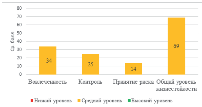
Рис. 3. Степень выраженности жизнестойкости и ее компонентов ЭГ вторичной диагностики (ср. балл)

По итогам проведенной развивающей работы, включающей в себя цикл из 14 занятий, цель которых состояла в повышении жизнестойкости и адаптивности пожилых людей, на контрольном этапе были получены результаты, которые свидетельствуют о наличии положительной динамики испытуемых ЭГ: если до проведения программы на констатирующем этапе жизнестойкость имела низкий уровень выраженности (ср. балл 61), то после проведения на контрольном этапе — средний уровень выраженности (ср. балл 69). Для КГ жизнестойкость и ее компоненты остались в прежней степени выраженности — высокой (рис. 3, 4). При этом, если на начальном этапе все участники имели высокий уровень жизнестойкости, на заключительном 2 человека перешли на средний уровень, что может быть связано с естественной динамикой событий, например, семейными конфликтами или ухудшением здоровья. Это показывает, что даже при высокой начальной устойчивости возможны временные колебания, однако большинство сохраняет высокий уровень, что подчеркивает необходимость постоянной поддержки и профилактики.